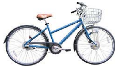
Comfort Bike (適合身高150-185cm人仕使用)