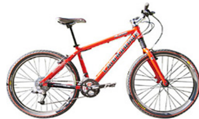
MTB : Cannondale F400